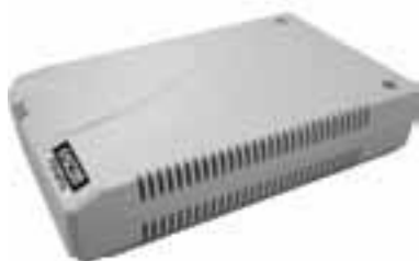
図 FTSP-MF01 外観