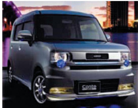
図4 車両取付イメージ