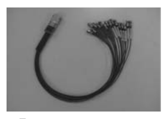
図1 InfiniBand<sup>™</sup> 4X Fan-Out Adapter