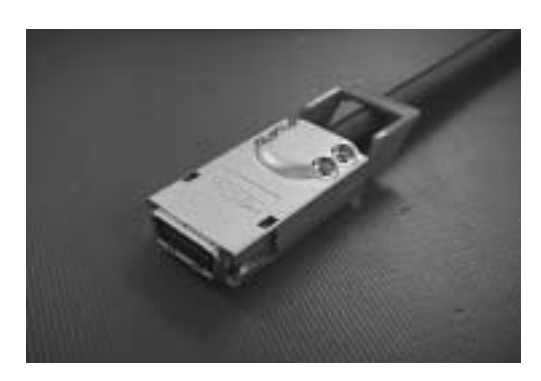
図2 InfiniBand™ 4Xコネクタ