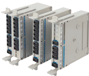
1x16、1x8、1x4 光スプリッタモジュール