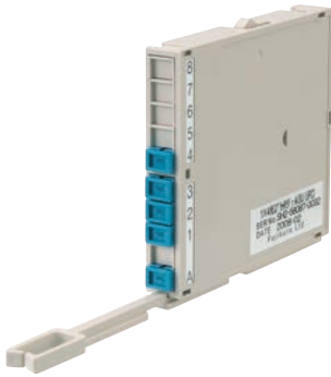
1x4 光スプリッタモジュール(3U)