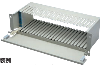
実装例 (シャーシ+モジュール)