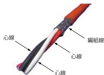
図2 3心一括シールド線