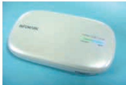
図 2 製品外観