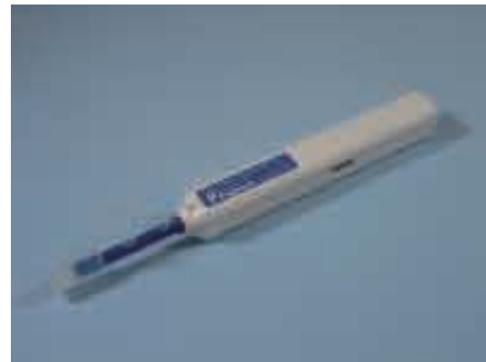
図2 One-Click® Cleaner MU/LC 外観