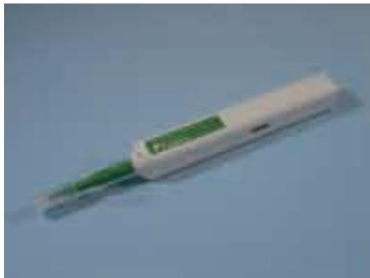
図1 One-Click® Cleaner SC 外観