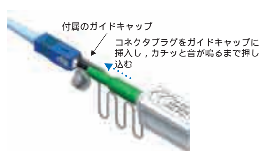
図4 コネクタプラグ単体のフェルル端面清掃