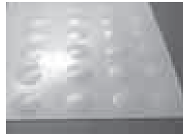
押さえシート全体